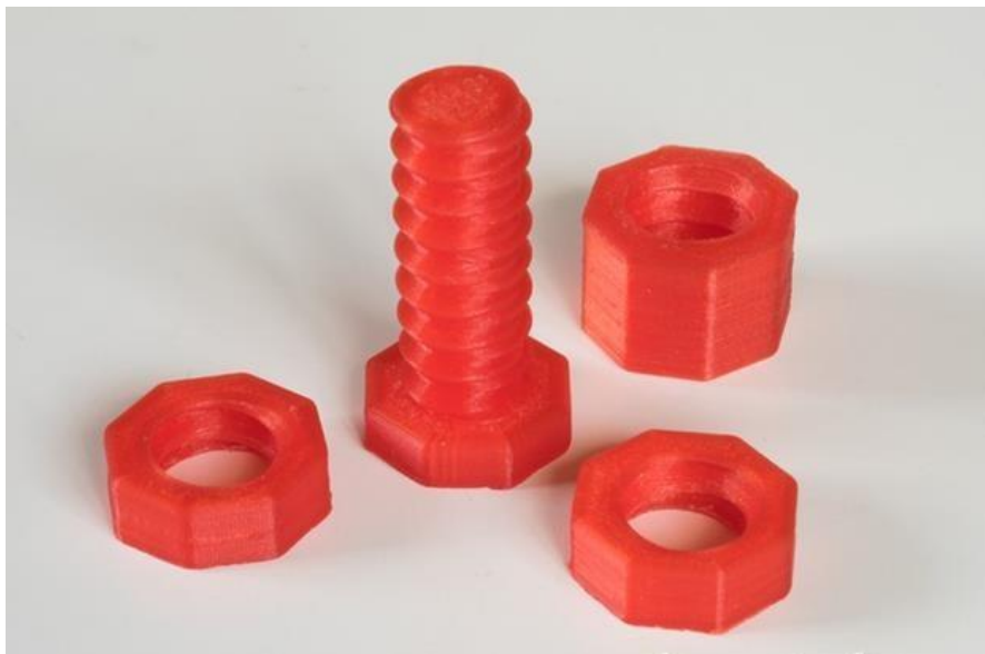
Рис. 1. Образец резьбового соединения болт-гайка.

Размеры: Фактический размер детали не более 60мм в высоту.