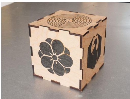
Рис. 1. Декоративный куб (образец)